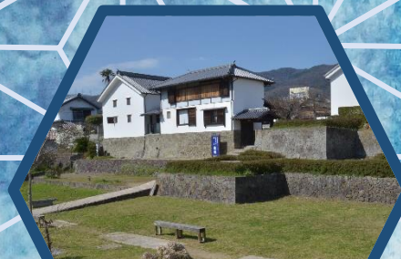
美馬市 市立図書館 11/30(土)～12/15(日)