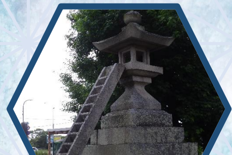
徳島市 阿波十郎兵衛屋敷 12/3(火)～12/13(金)