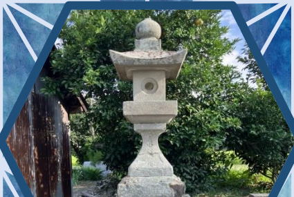
上板町 歴史民俗資料館 11/12(火)～11/24(日)