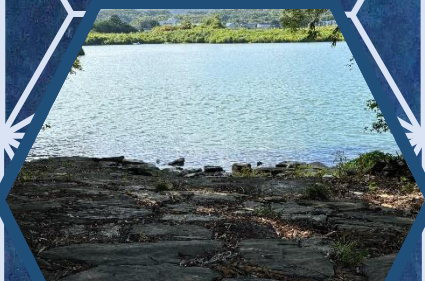
藍住町 藍住町歴史館「藍の館」 10/2(水)～11/4(月)