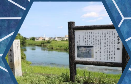
板野町 文化の館 11/12(火)～11/17(日)