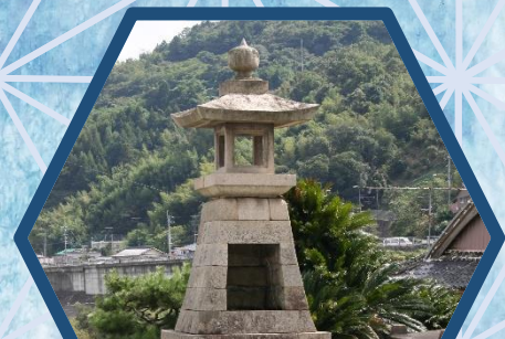
阿波市 市役所 11/18(月)～11/29(金)