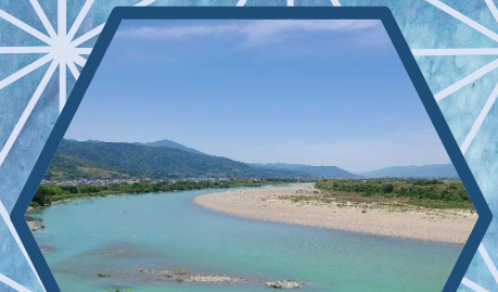
吉野川市 文化研修センター 11/12(火)～11/18(月)